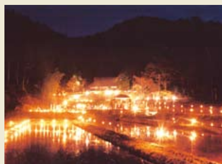
[農村あかり展:みんなの心(景観)に“あかり”を灯す]農村景観の一体感を表現