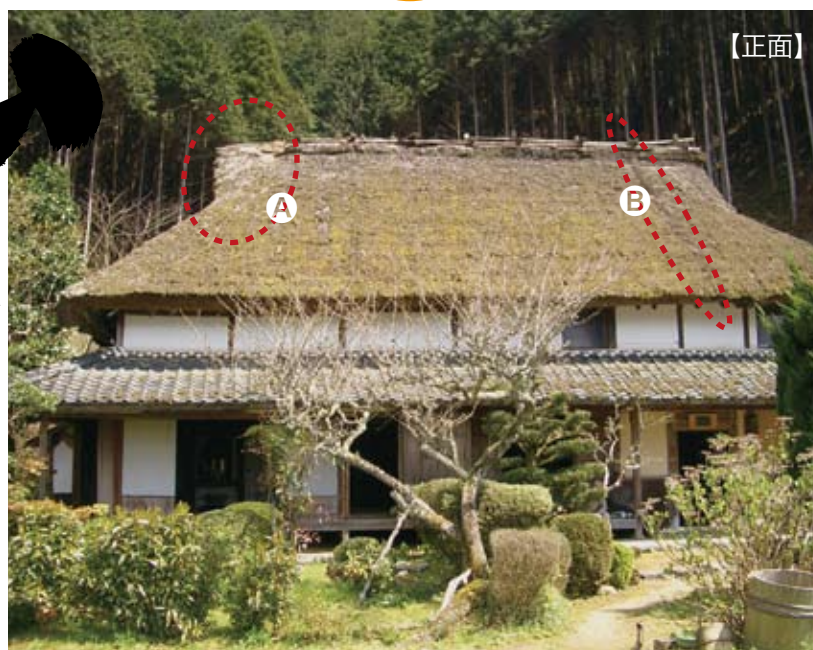
◎台風23号により干木が飛び、特に傷みがひどくなっている。 ◎集中豪雨や突風で、傷みが予想以上の速さで進み、雨水の通る道ができています。