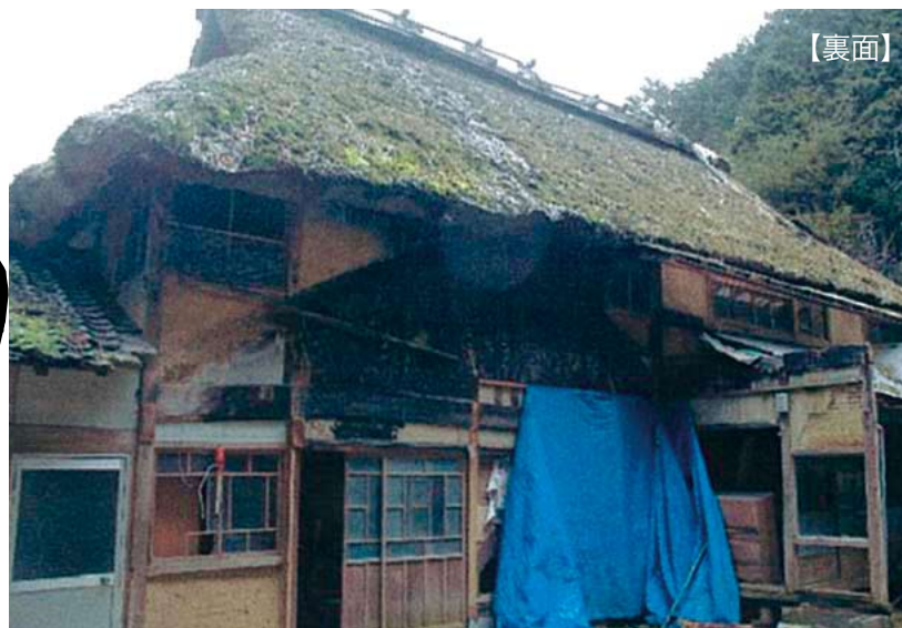
◎台風により裏山の桜が倒木した際、増築部分が直撃を向け、解体。 ◎家屋の老朽化が進み、風雪への耐久が不足している。