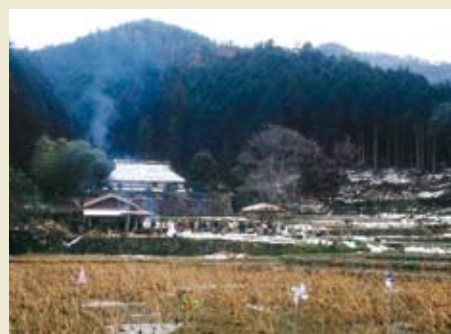
[節分草祭り:春のおと(音)づれ]貴重種セツブンソウを核に環境保全を表現